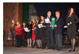
Illustrazione 4: La giuria