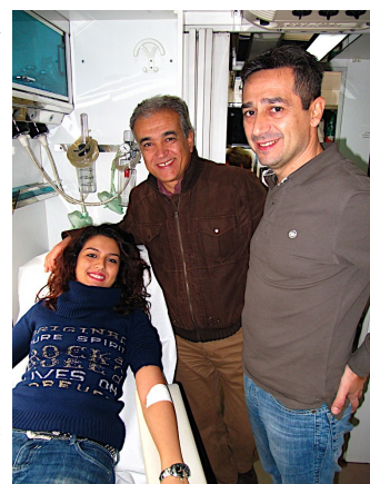
Illustrazione 1: Il Presidente durante una raccolta