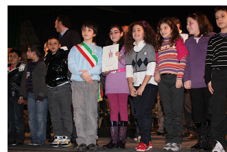
Illustrazione 2: I piccoli concorrenti